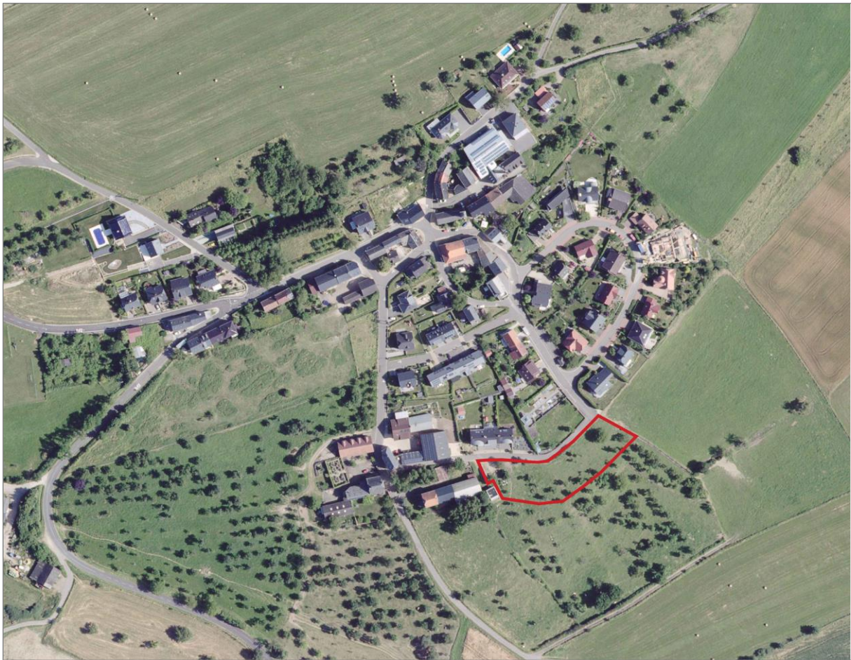
Abbildung 1: Luftbild mit Plangebietsabgrenzung (rot) (genordet, ohne Maßstab).

Im Rahmen der PAG-Prozedur wurde auf Basis von Reklamationen die Zonierung des Plangebietes von einer „zone agricole“ in eine „zone d’habitation 1“ geändert. Weiterhin wurde das Plangebiet mit einer „zone de servitude urbanisation“ überlagert.